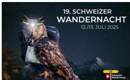
JPG, FORMAT 1500 X 927