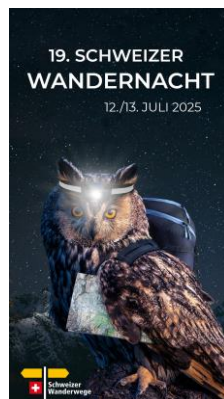
JPG, FORMAT 1080 X 1920