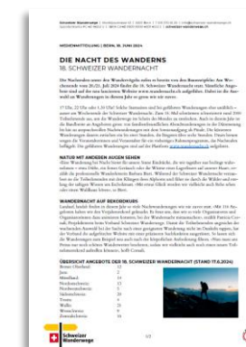
MEDIENMITTEILUNG (VERFÜGBAR AB JUNI 2025)