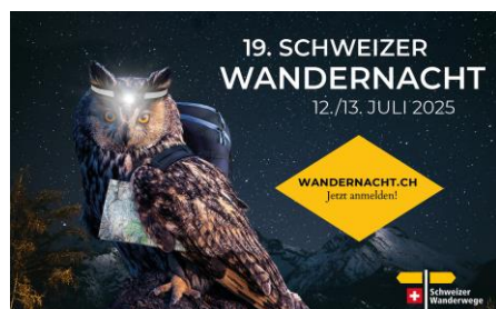
JPG, FORMAT 1500 X 927 MIT STÖRER