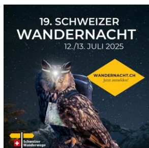
JPG, FORMAT 1080 X 1080 MIT STÖRER