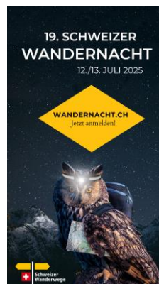
JPG, FORMAT 1080 X 1920 MIT STÖRER