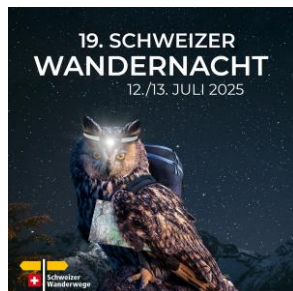
JPG, FORMAT 1080 X 1080