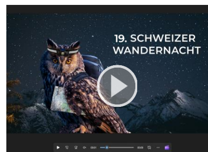
MP4-VIDEO (ANIMATION), FORMAT 16:9