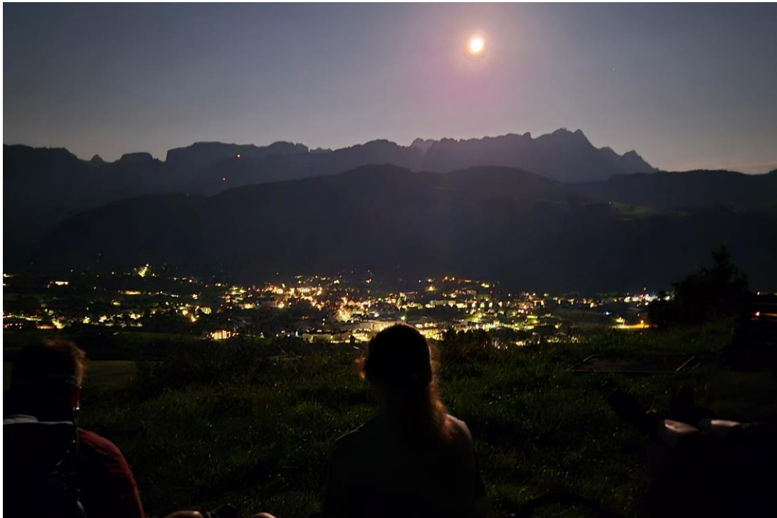
Photo: Appenzell Ausserrhoder Wanderwege VAW 18 e Nuit suisse de la randonnée 2024

Agréable ou exigeante, effrayante ou informative, culturelle ou culinaire: vous pouvez concevoir votre offre librement!