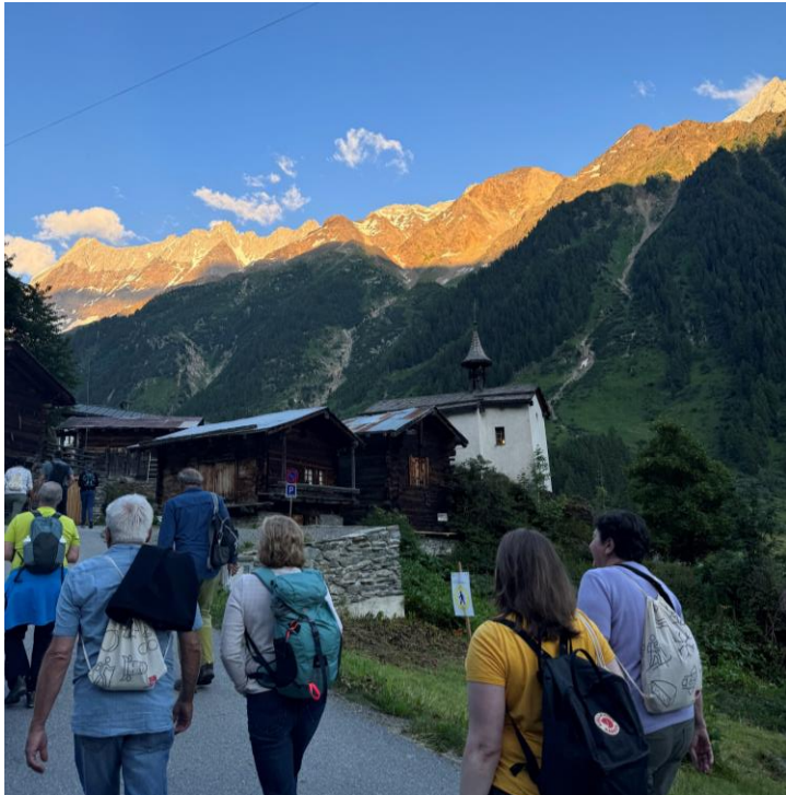
18 e Nuit suisse de la randonnée 2024