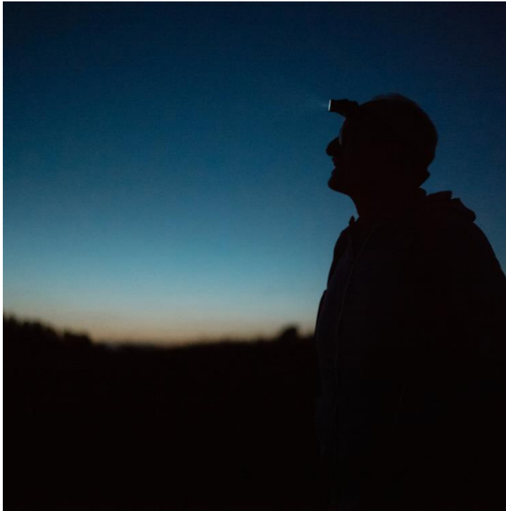
18 e Nuit suisse de la randonnée 2024