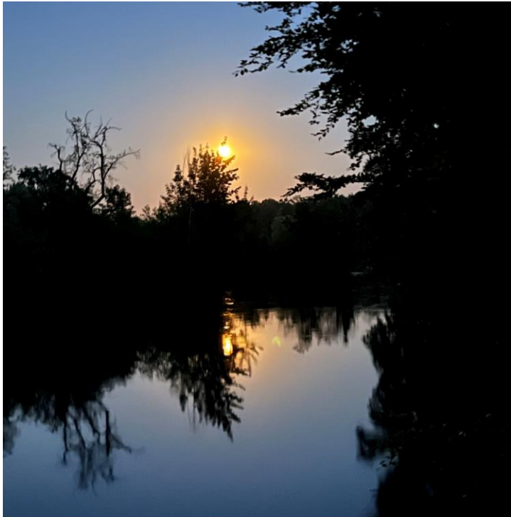
18 e Nuit suisse de la randonnée 2024

Quel soutien offre Suisse Rando aux organisatrices et organisateurs?