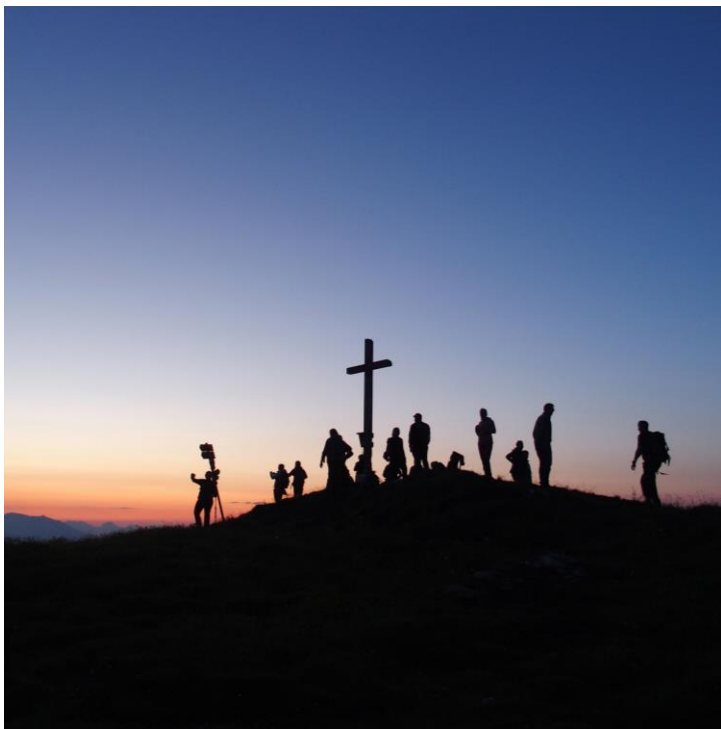
Photo: Surselva Tourismus Info Lumnezia 18 e Nuit suisse de la randonnée 2024

Pourquoi participer à l'événement en tant qu'organisatrice ou organisateur?