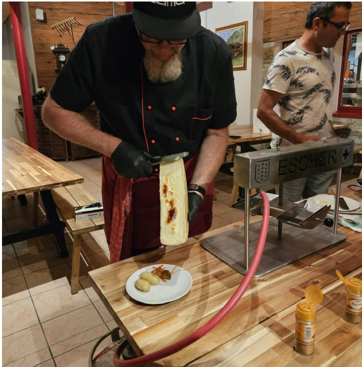
18 e Nuit suisse de la randonnée 2024

Voici à quoi pourrait ressembler votre événement: randonnées avec offre complémentaire (en option)