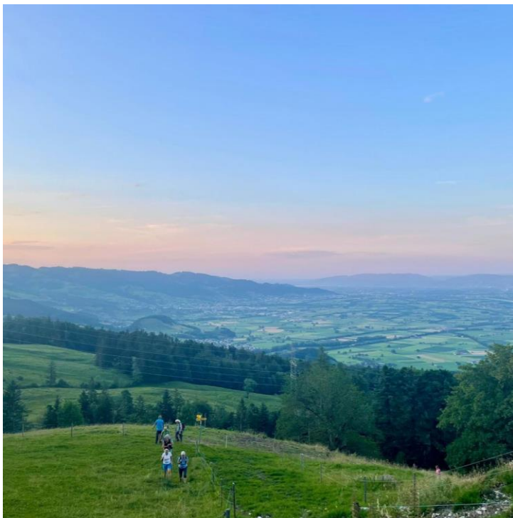
18 e Nuit suisse de la randonnée 2024