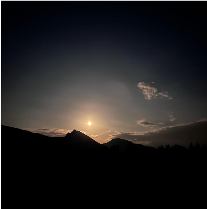
18 e Nuit suisse de la randonnée 2024