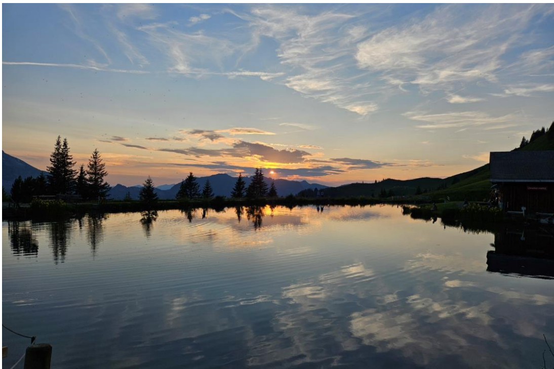
18 e Nuit suisse de la randonnée 2024