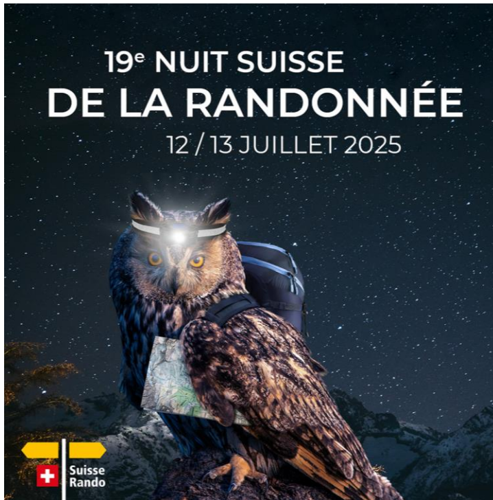
Un oiseau de nuit, symbole de la Nuit suisse de la Randonnée